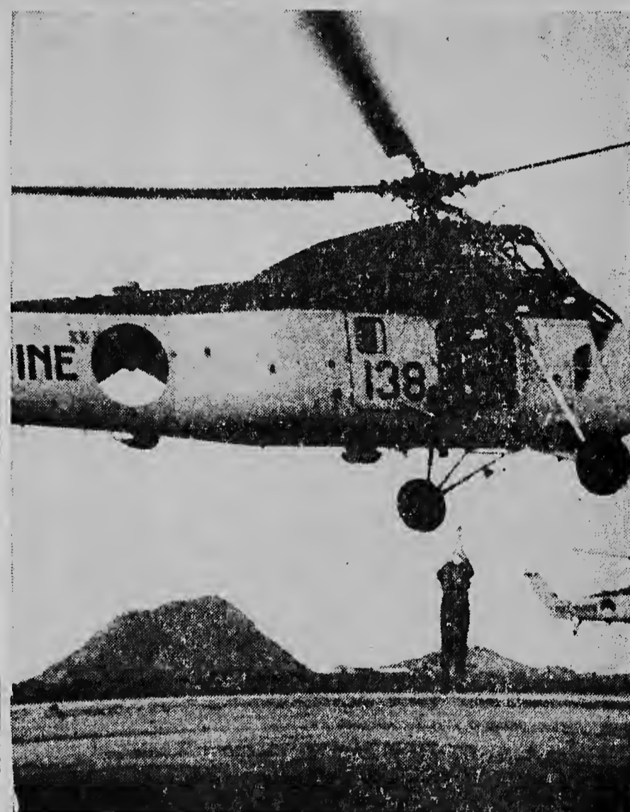
E portret aqui ta mustra claramente com ta posible di cohe un persona cu helicopter foi suela of foi lamar. Na un kabel fuerte y un lus na dje nan ta largo e persona aqui vier tranquilo ariba of abao. Na e maniobra aqui e aparato ta queda para imovil den larja.